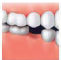
Falta un diente

El implante dental es la mejor opción a la hora de sustituir una pieza dental, cuya pérdida haya sido provocada por cualquier motivo, ya sea por envejecimiento o por traumatismo. No afecta a las piezas dentarias sanas, y evita que el hueso maxilar se desgaste