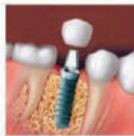
Se coloca la corona sin afectar a los dientes sanos contiguos