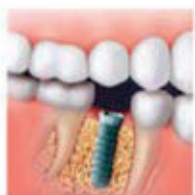
Se coloca el implante dental que sustituye a la raíz